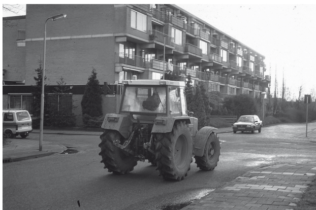
Auto van de zaak

De bovenstaande techniek van belastingheffing wordt bij de belastingen van winst, loon en andere inkomsten (nog) niet toegepast.